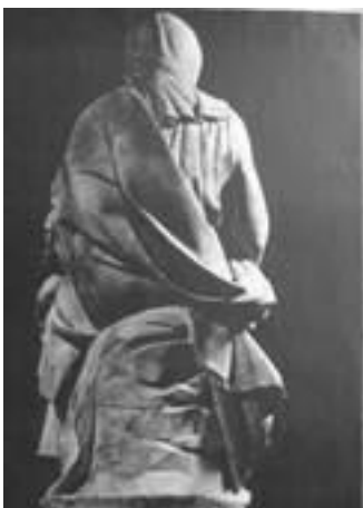
ミケランジェロ(背面)