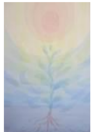
*ローズウインドウ作り